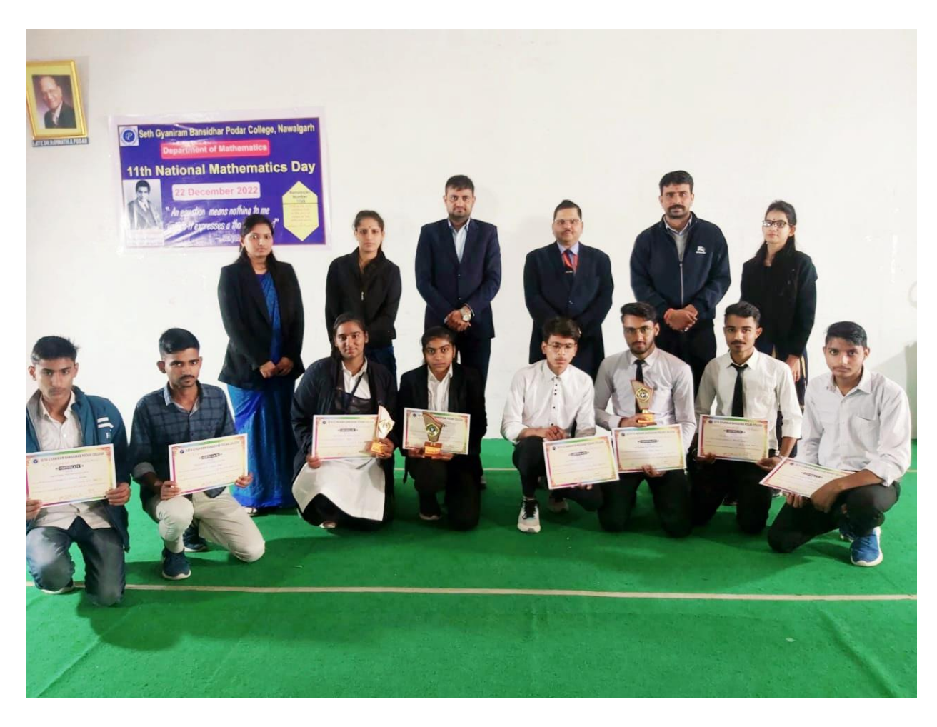
Prize distribution on National Mathematics Day, 2022